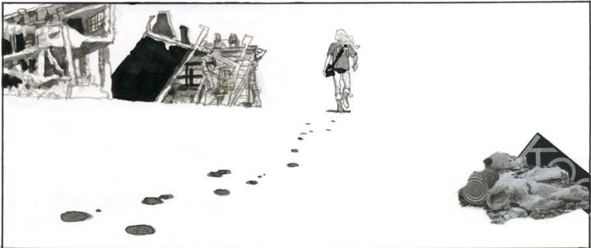
Ci-dessus : Guillaume Trouillard, Aquaviva (extrait). Ci-dessous : un originale d'Étienne Lécroart.