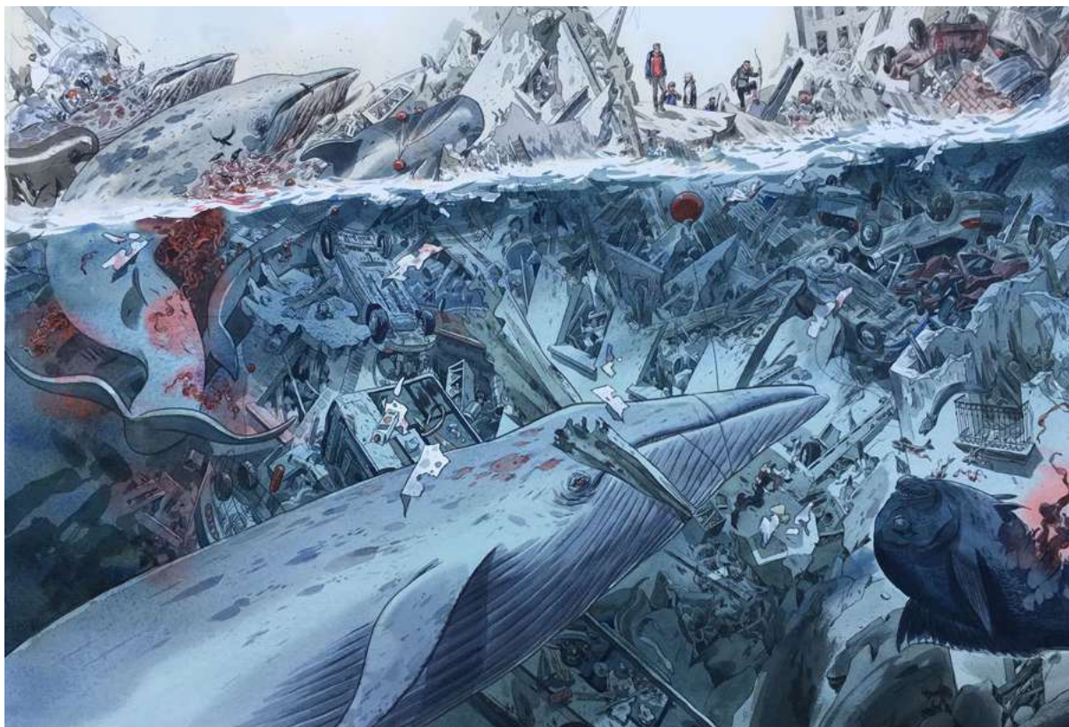
Ci-dessus : Jean-Christophe Chauzy, Le Reste du monde (extrait).