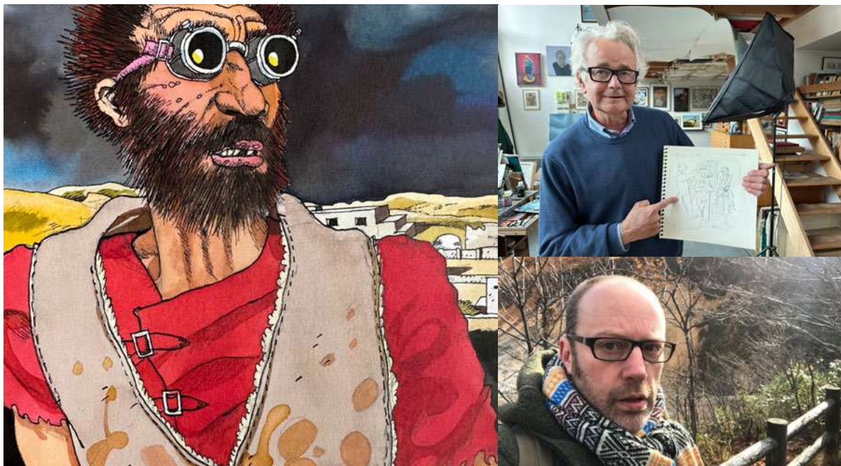
Ci-dessus, à gauche. Extrait de « L'Homme de Sable », dessins Loustal, scénario Paringaux, première parution dans Métal Hurlant , 1981. A droite, en haute : Jacques de Loustal. En bas : Erwin Dejasse. Ci-dessous un panoramique de Loustal.

Plus d'infos : https://sobd2023.com/les-artistes/invites-dhonneur/