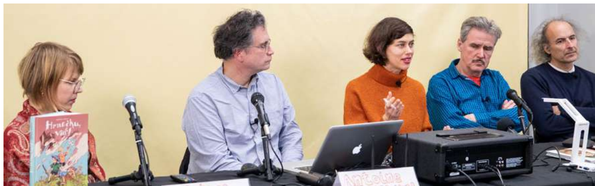
Ci-dessus : tables rondes sur la bande dessinée tchèque sur le SoBD 2022.

https://sobd2023.com/les-rencontres/cycle-etranger/